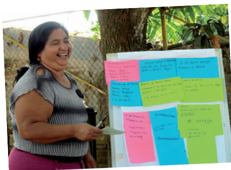
La Asociación Solidaridad CVX - Servicio Jesuita para el Desarrollo es miembro de la Comunidad de Aprendizaje y Acción para el Desarrollo Alternativo COMPARTE.

Además de facilitarles el acceso a recursos económicos, estos grupos se convierten en espacios donde las mujeres ejercen la toma de decisiones, la autonomía y la gestión del poder individual y colectivo, ya que son ellas quienes establecen las reglas de sus grupos. En caso de que se incorporen hombres al grupo, solo las mujeres pueden seguir ejerciendo cargos directivos. Asimismo, son grupos que sirven como espacios de esparcimiento y de ampliación de las redes sociales en los que sus integrantes van construyendo vínculos colectivos.